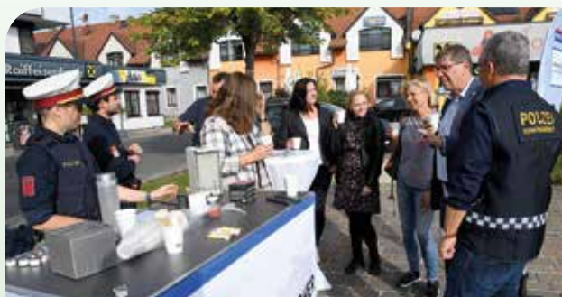
Aktion „Coffee with Cops“