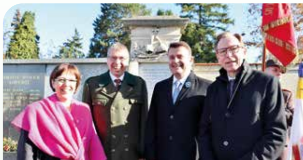
Kranzniederlegung des Souvenir Francais