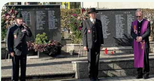
Totengedenken mit Kranzniederlegung