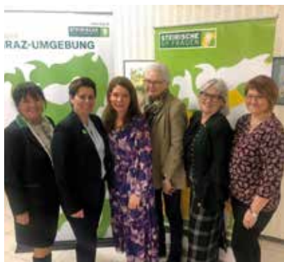
Bezirkstag der VP Frauen GU