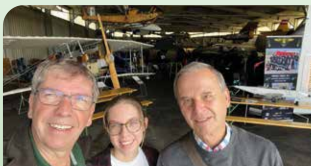
Luftfahrtmuseum Graz-Thalerhof feiert 50 Jahre