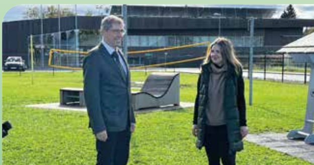
Dreharbeiten zu einem Imagefilm über Feldkirchen