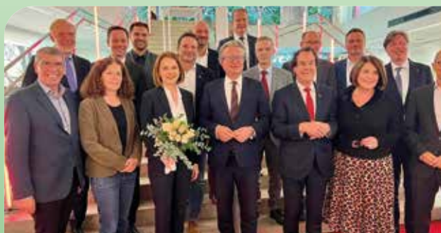
Verleihungsgala des Hans Roth Umweltpreises 2023