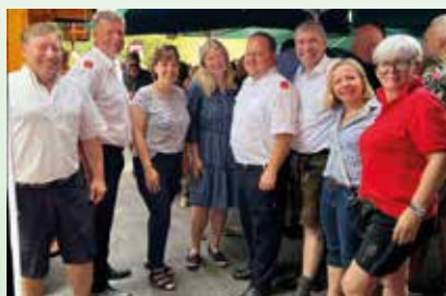
FF Wagnitz Frühschoppen