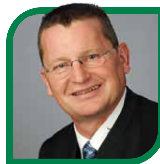
GR MAG. GOTTFRIED PABST