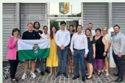
Hofübergabe in der Jungen ÖVP