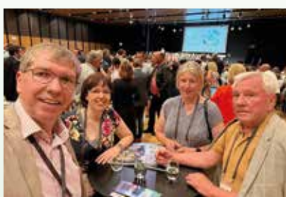
69. Gemeindetag in Innsbruck