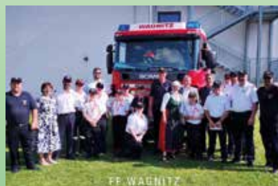
FF Wagnitz Bereichsjugendleistungsbewerb